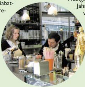
Alfredo: soeben als bestes Café Deutschlands ausgezeichnet

Auf der Jungweinprobe präsentieren am 15. Mai mehr als 70 renommierte deutsche Weingüter ihre Erzeugnisse des Jahrgangs 2009. In der Zeit von 13 bis 20 Uhr können Besucher sämtliche angebotenen Weine, Sekte und Spirituosen probieren, Fachgespräche mit den Winzern führen und das Lieblingströpfchen natürlich auch kaufen oder bestellen. Veranstaltungsort ist das noble Grandhotel Schloss Bensberg , der Eintritt kostet 10 Euro (jungweinprobe.de).